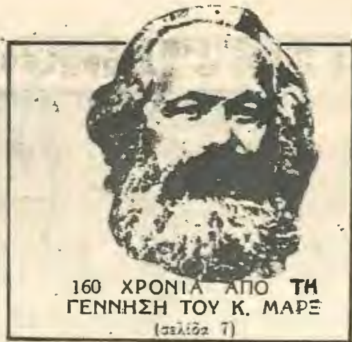
160 ΧΡΟΝΙΑ ΑΠΟ ΤΗ ΓΕΝΝΗΣΗ ΤΟΥ Κ. ΜΑΡΕ (σελίδα 7)